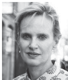
© Writ De Terra / Opale / Éditions Actes Sud

RELATIONS PRESSE : Sophie Patey (01 55 42 14 43)