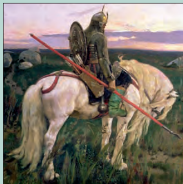
Victor Mikhailovich Vasnetsov